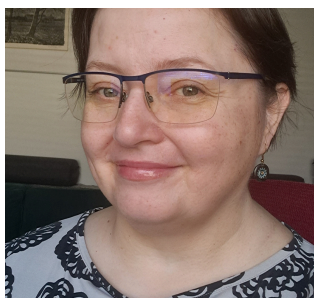
NB! Kadunud kõrvarõngas jälle kõrvas